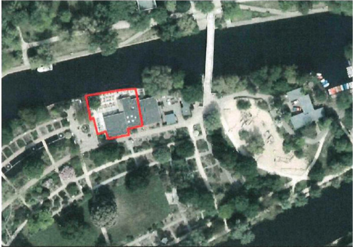
Druckdatum: 28.11.2017, ungefähre Lage des Grundstücks rot