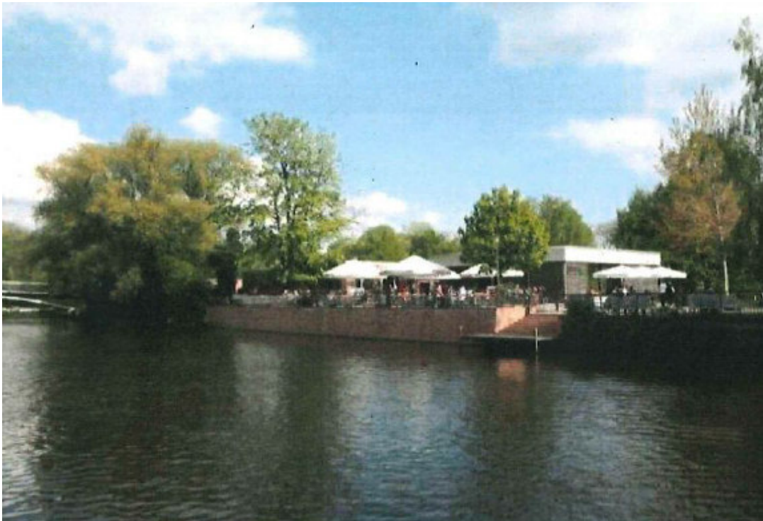
Ansicht vom Wasser